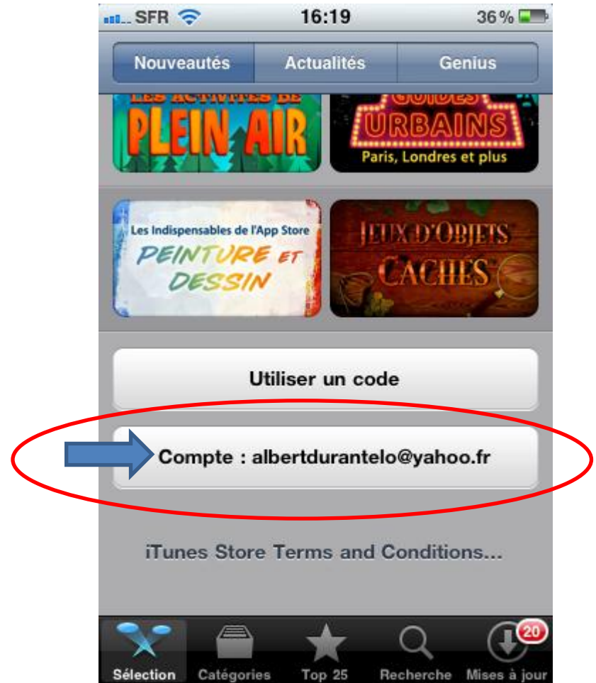
Bas de la page