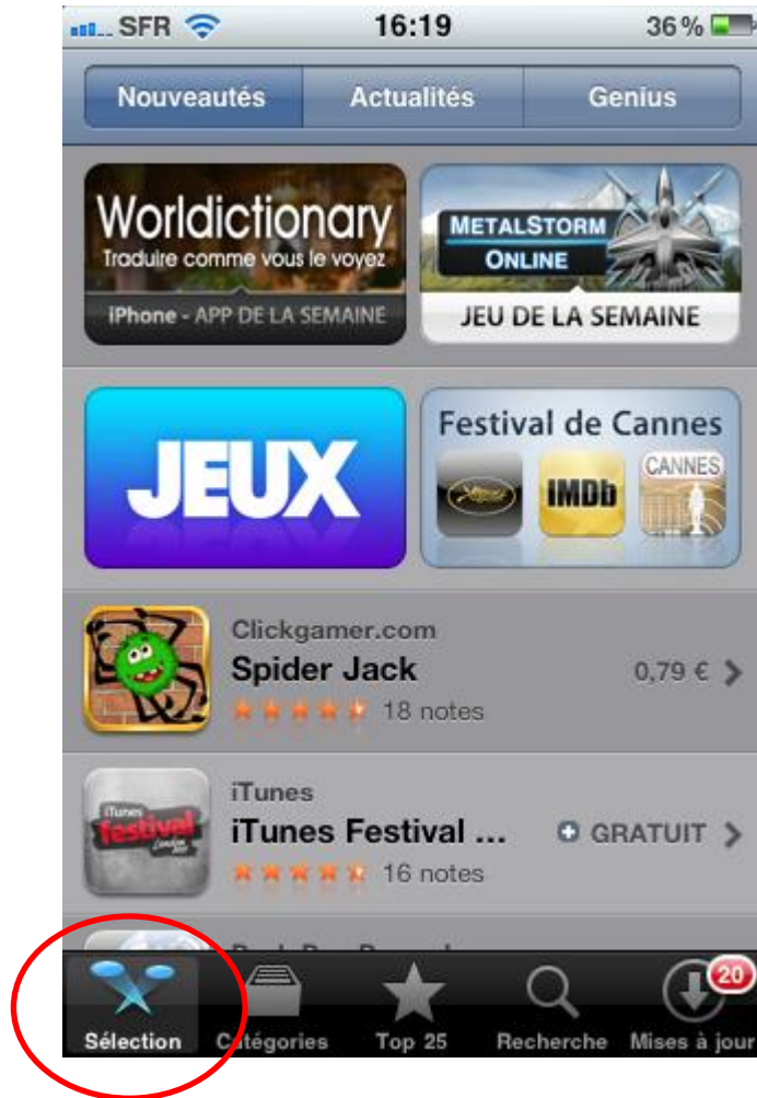
Haut de la page

2 - Descendez en bas de la page de la section « Sélection » puis cliquez sur « compte » et entrez vos identifiants.